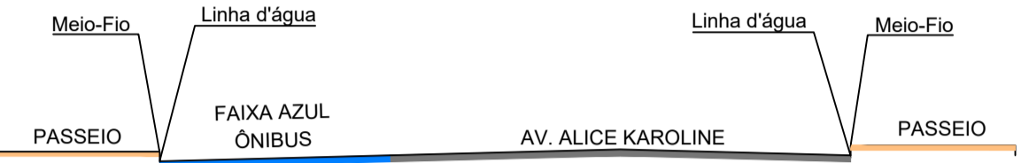
DETALHE SEÇÃO TRANSVERSAL A - A' AV. ALICE KAROLINE ESCALA: 1/100