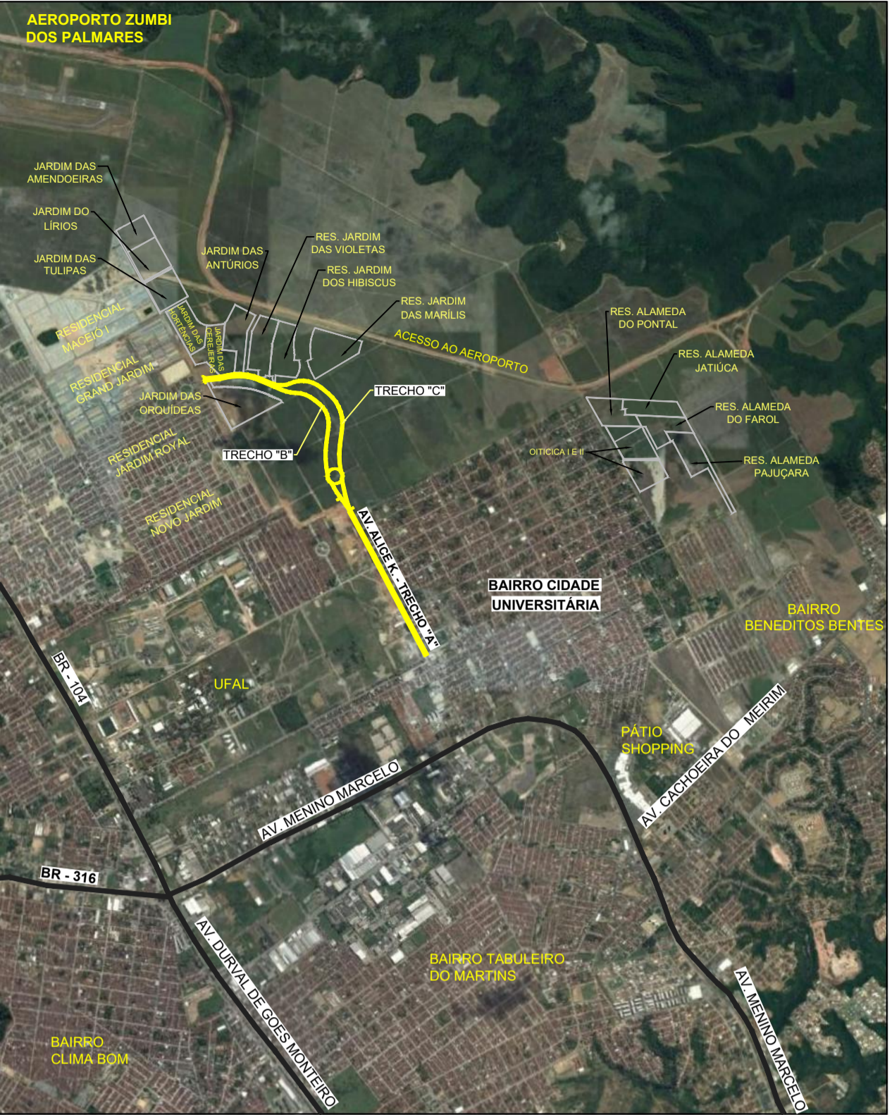
PLANTA DE SITUAÇÃO SEM ESC.